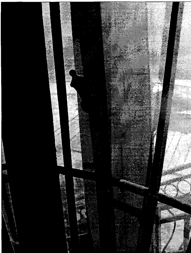
Фото 5 Фурнитура на окне юго-западного фасада.