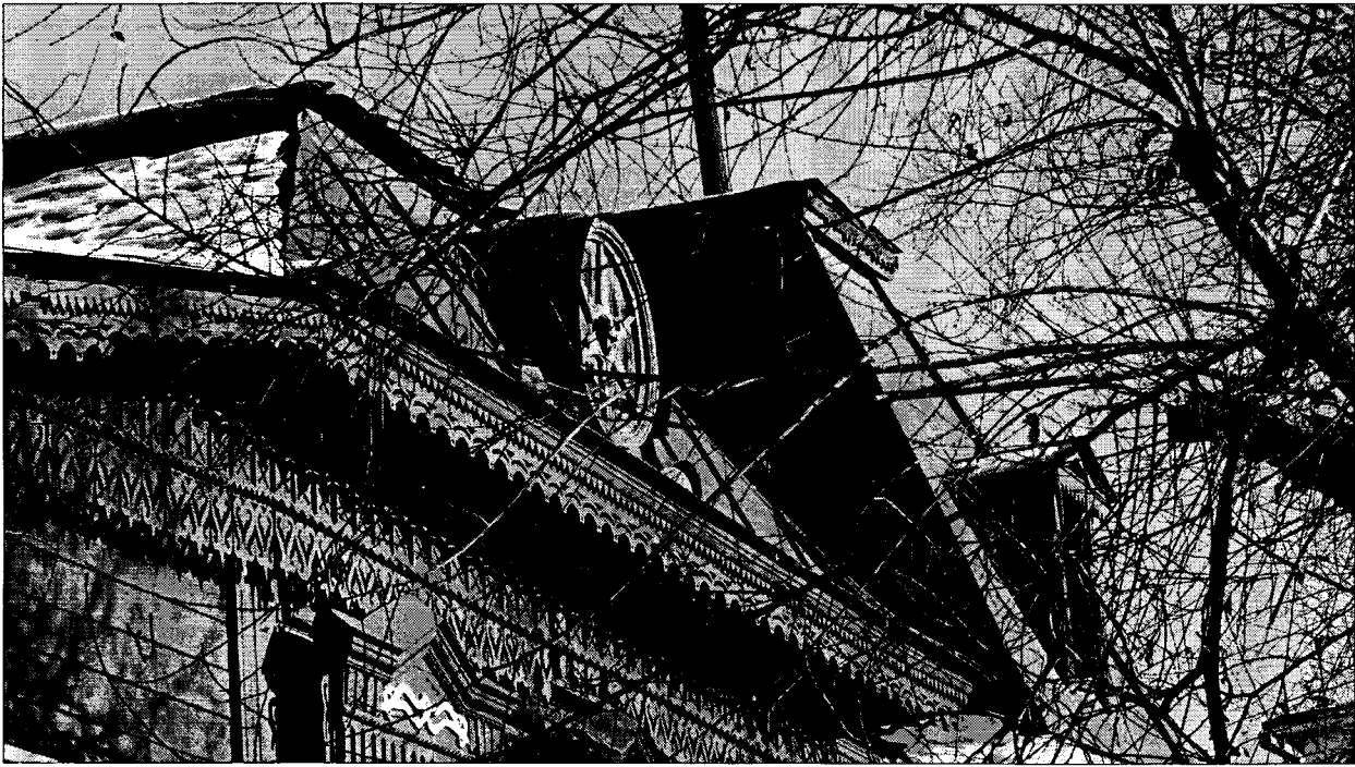
Фото 3 вид с запада. Шатровые крыши.