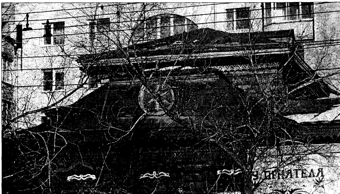
Фото 2 Фрагмент юго-западного фасада (крыши)