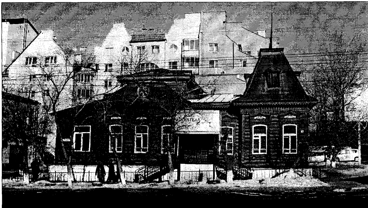
Фото 1 главный юго-западный фасад