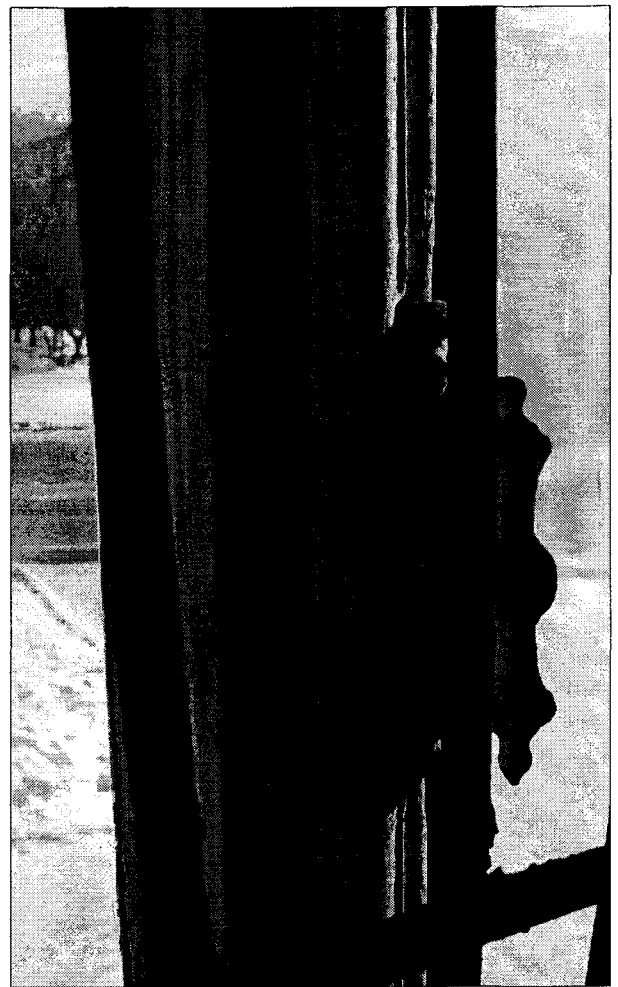
Фото 6, 7 Фурнитура на окнах юго-восточного фасада.