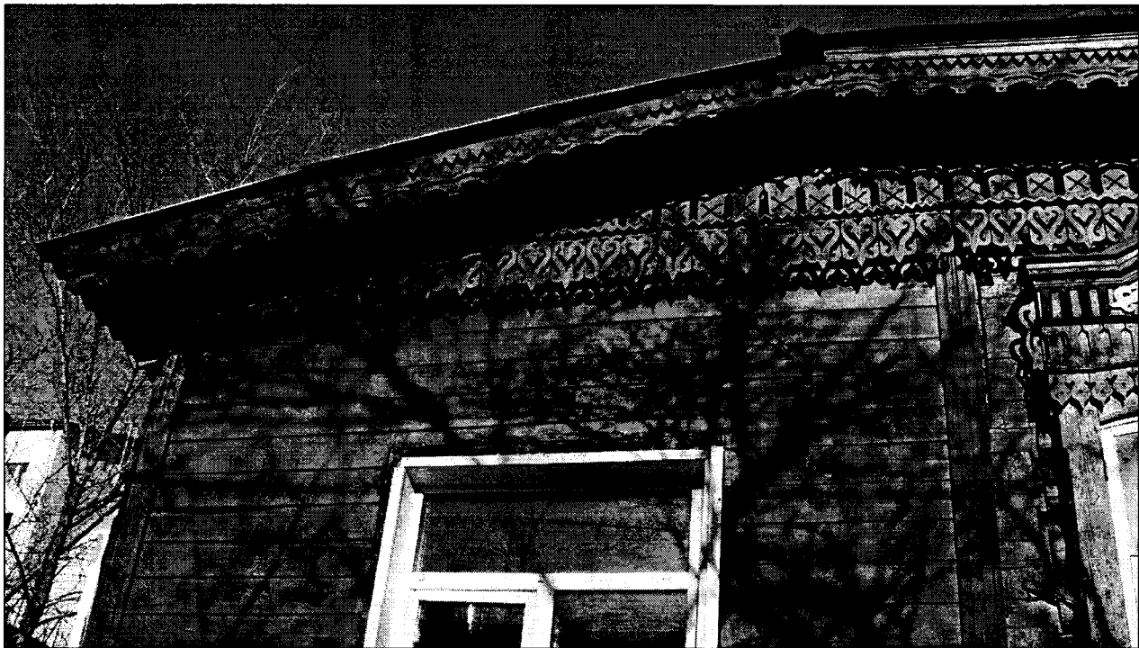
Фото 4 Объем веранды.