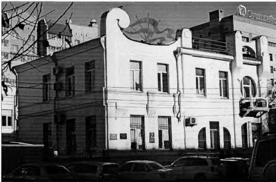
«Усадьба Коновалова. Дом доходный». Главный юго-западный фасад.

«Усадьба Коновалова. Дом доходный», г. Чита, ул. Амурская, д. 106