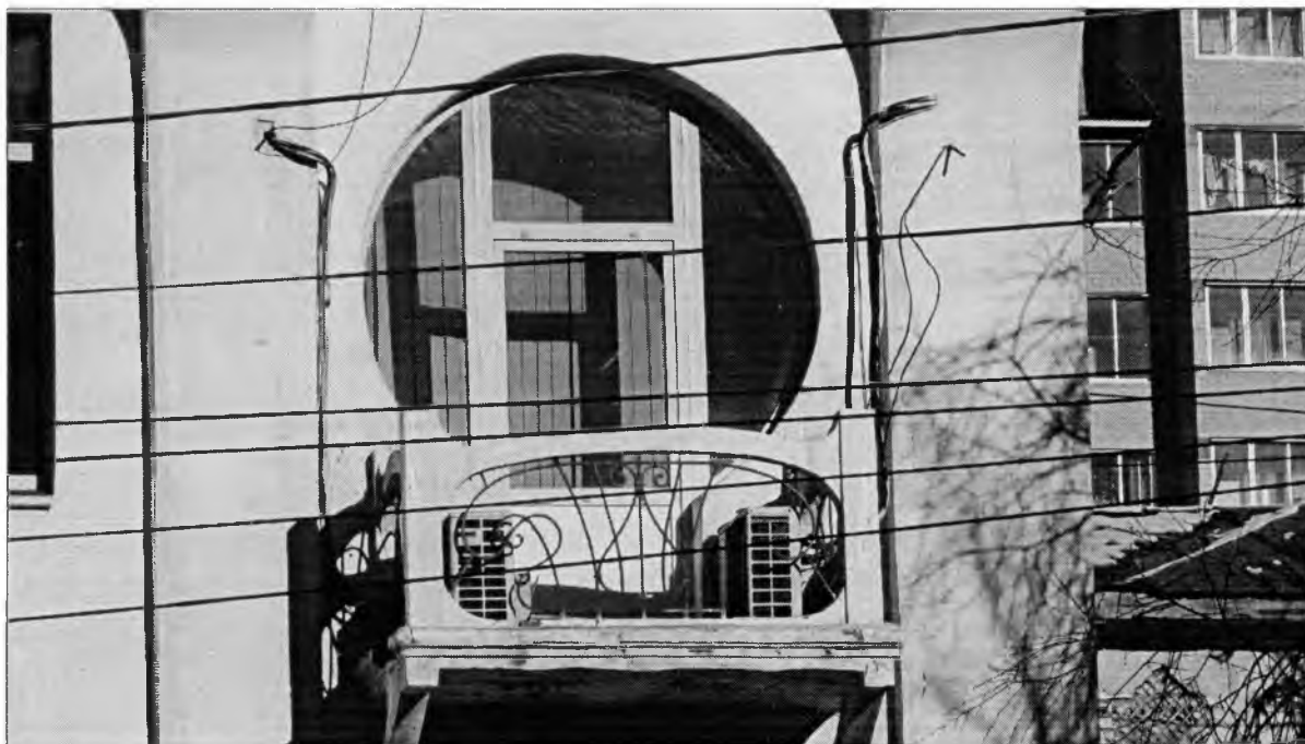
«Усадьба Коновалова. Дом доходный». Балкон главного юго-западного фасада.